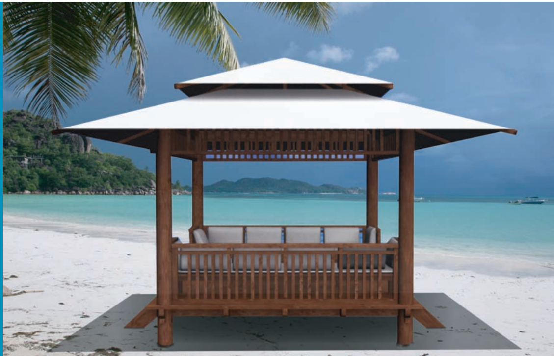
Modèle Uluwatu, © Yogja Déco

Offrez-vous un coin de paradis chez vous