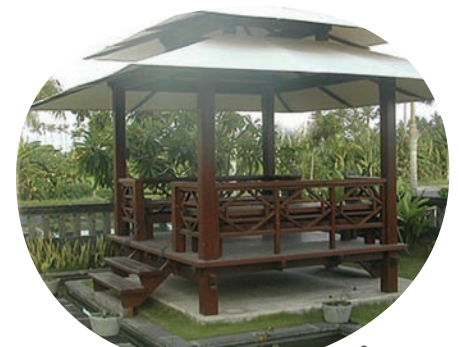
Exemple de réalisation