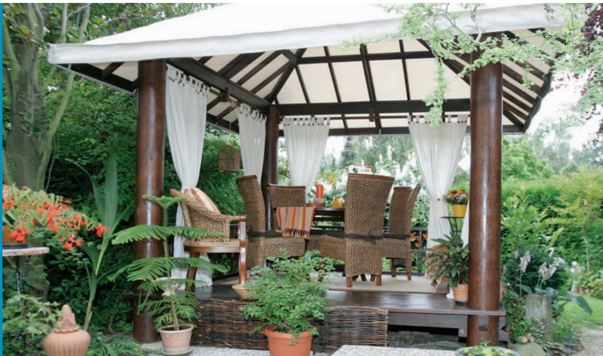
Modèle Lucas2 Toile © Yogja Déco

Offrez-vous un coin de paradis chez vous