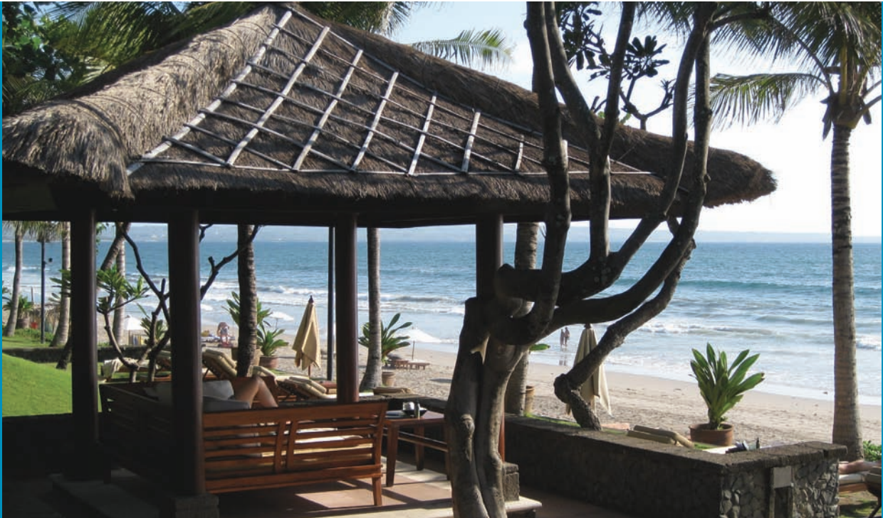
Modèle Lucas2 Chaume

Offrez-vous un coin de paradis chez vous