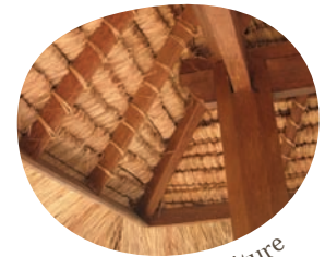
Détail sous toiture

Autres dimensions disponibles, n'hésitez pas à nous consulter.