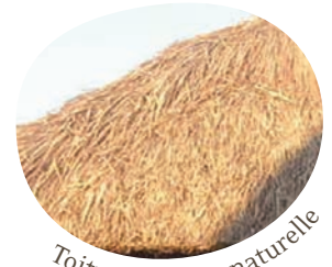
Toiture en fibre naturelle

Couverture : fibre naturelle (alang - alang) ou fibre artificielle Palmex®.